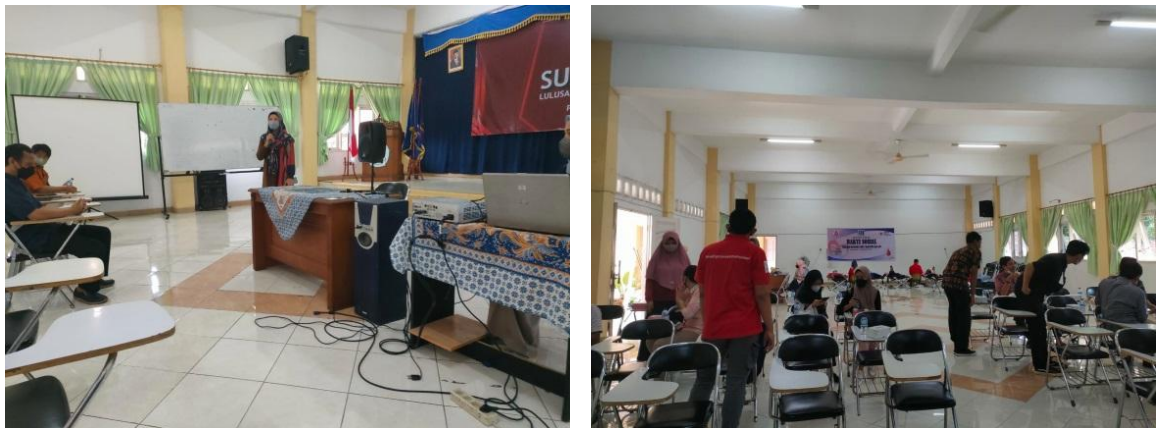
Gambar 2. Pelaksanaan kegiatan sosialisasi dan donor darah

Akhirnya, tuntas sudah kegiatan ini dengan banyak nilai-nilai kehidupan dan kemanusiaan yang didapatkan oleh dosen, mahasiswa serta masyarakat luas. Pemahaman dan kesadaran implementasi nilai-nilai kemanusiaan terutama untuk kawula muda yaitu mahasiswa sangat diperlukan, salah satunya melalui kegiatan seperti ini. Mahasiswa yang merupakan generasi penerus bangsa harus peduli dengan isu-isu kemasyarakatan maupun kemanusiaan sebagai bekal hidup bermasyarakat. Adapun gambaran pelaksanaan kegiatan ditunjukkan oleh Gambar 2.